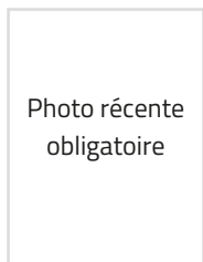
Photo récente obligatoire

ADRESSE E-MAIL* (une adresse mail par abonné, même si c'est un enfant)* .....